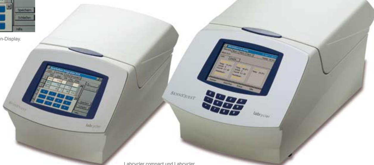
Labcyler compact und Labcyler